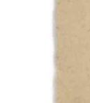
米 近く新原子力実験